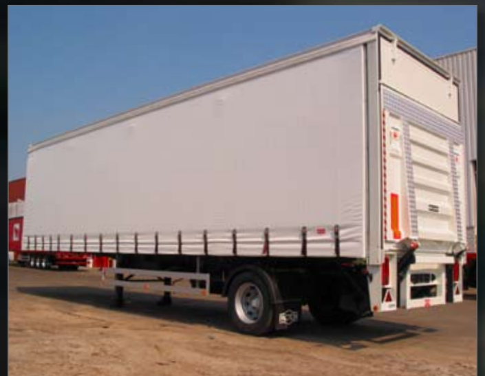
City X-press uitgevoerd met achtersluitende laadklep