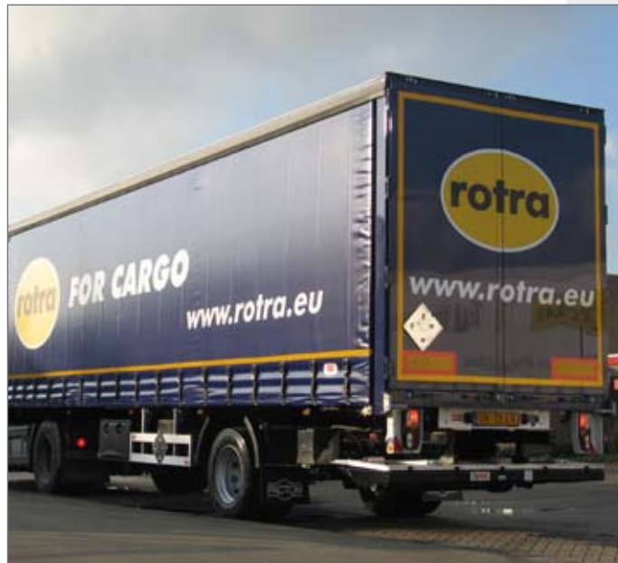
Uitvoering met onderschuiflaadklep en vlakke achterdeuren

Vraag naar de mogelijkheden! Pacton ontwikkelt graag uw optimale transportoplossing.