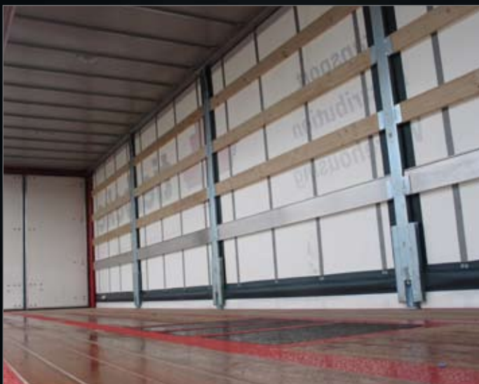
Binnenverlichting tegen het dak gemonteerd