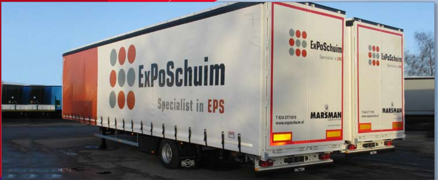
13.600 mm uitvoering met starre as ter behoeve van volumetransport