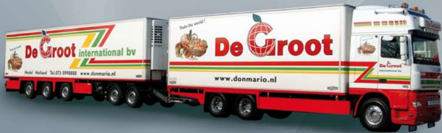
LZV: bakwagen met 2-assige dolly met onderbouw trekboom en 3-assige oplegger.