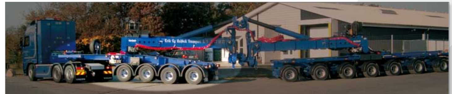
4-assige jeepdolly in bedrijf.