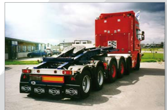
Scandinavische uitvoering van de 2-assige jeepdolly.