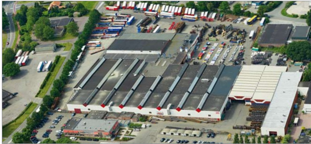
Pacton hoofdvestiging te Ommen