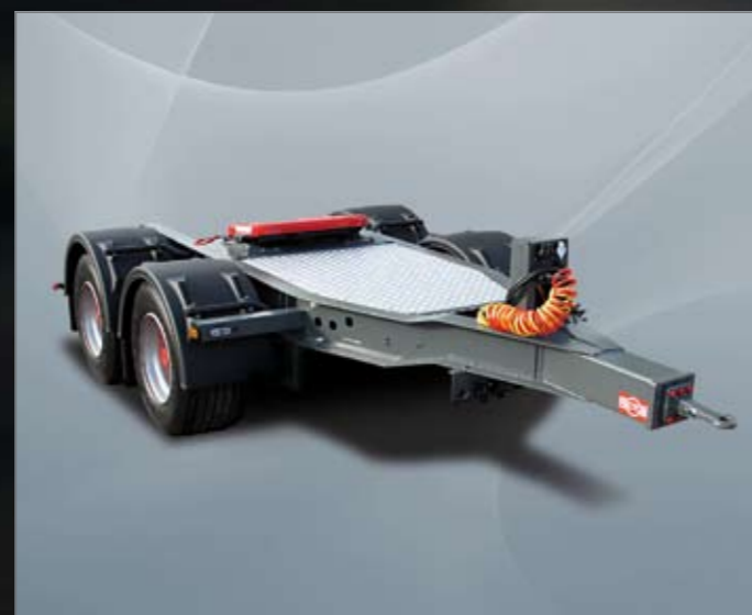
2-assige Dolly met rechte trekboom.