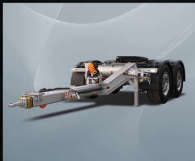
2-assige Dolly met onderbouw trekboom.